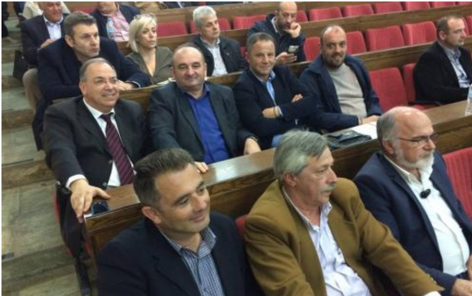
View the full image [22]