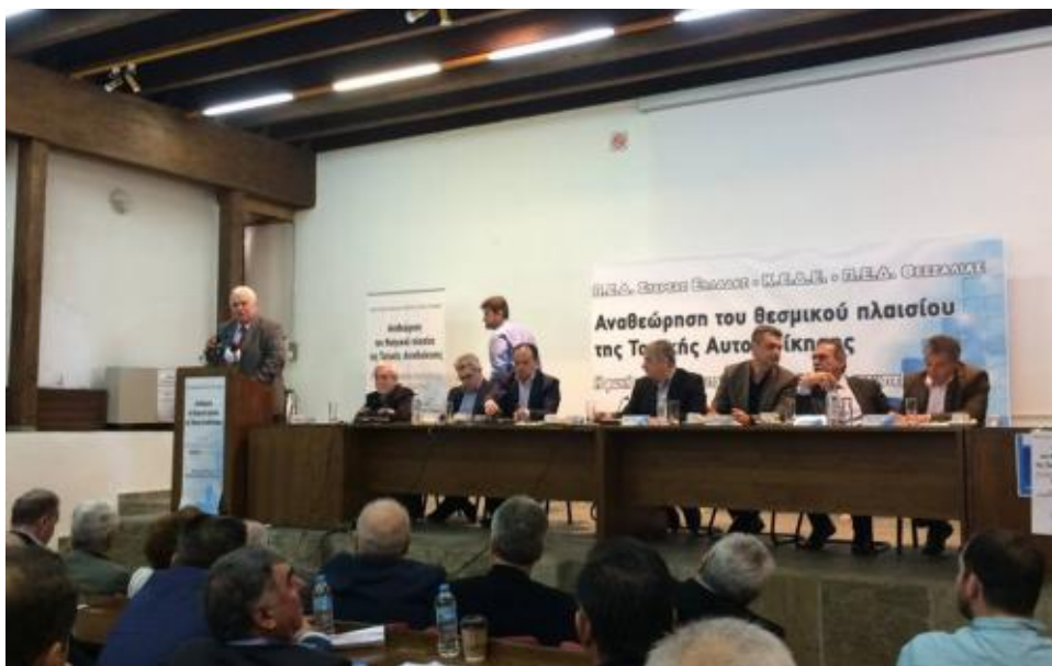
View the full image [17]