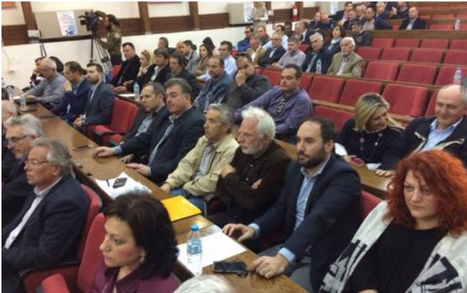
View the full image [23]