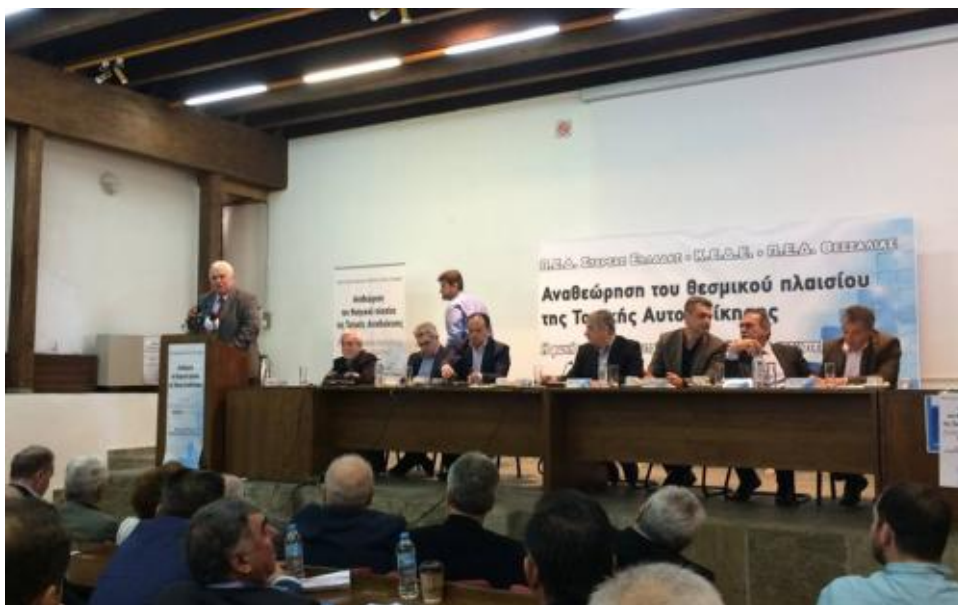
View the full image [17]