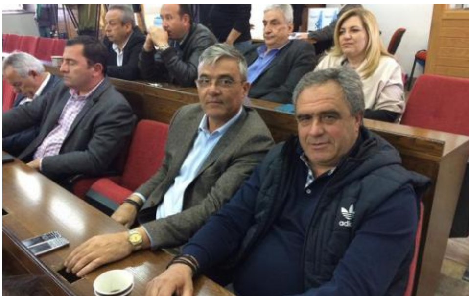
View the full image [27]